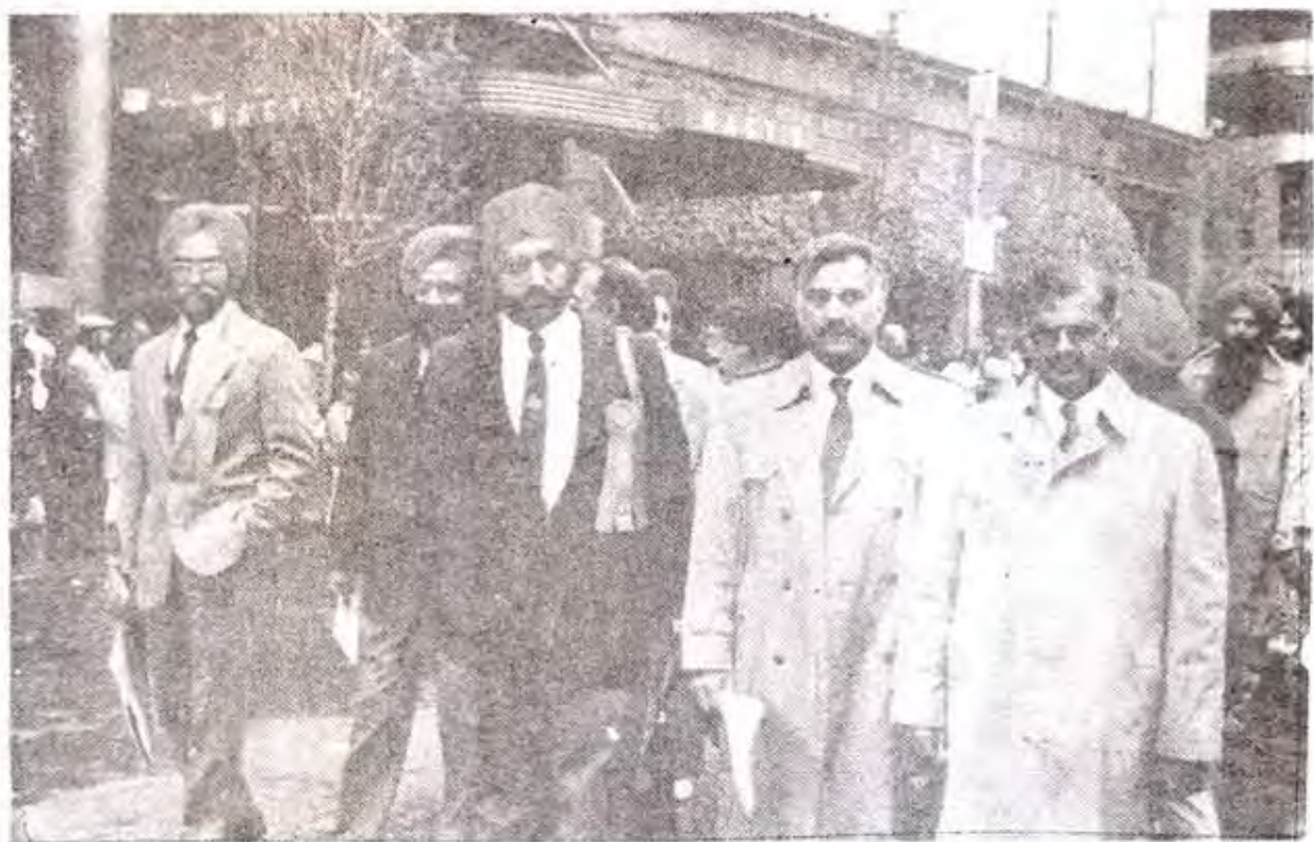
نیویارک میں کشمیریوں اور سکھوں کی مشترکہ استہجائی ریلی میں