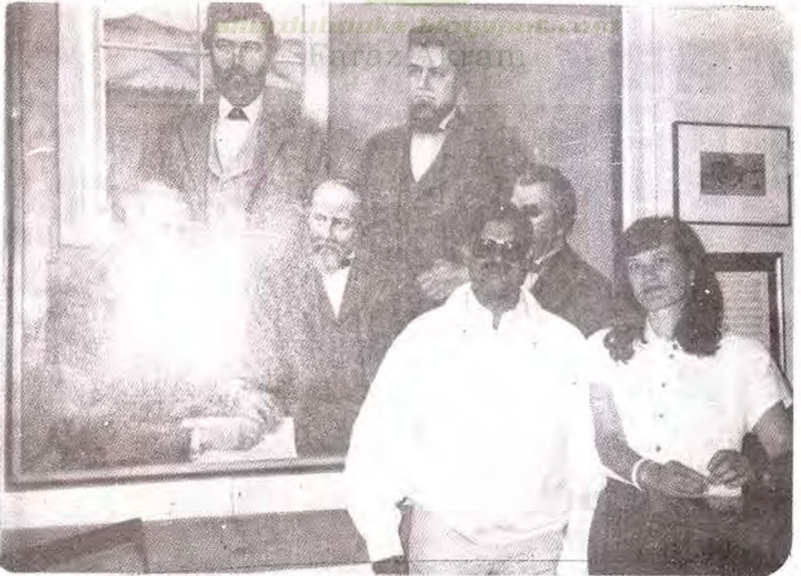
سیکرٹریٹ اولڈ سٹی کے ٹاک خانے کی انچارج اور پہلے آباد کاروں کی تصاویر کے ساتھ