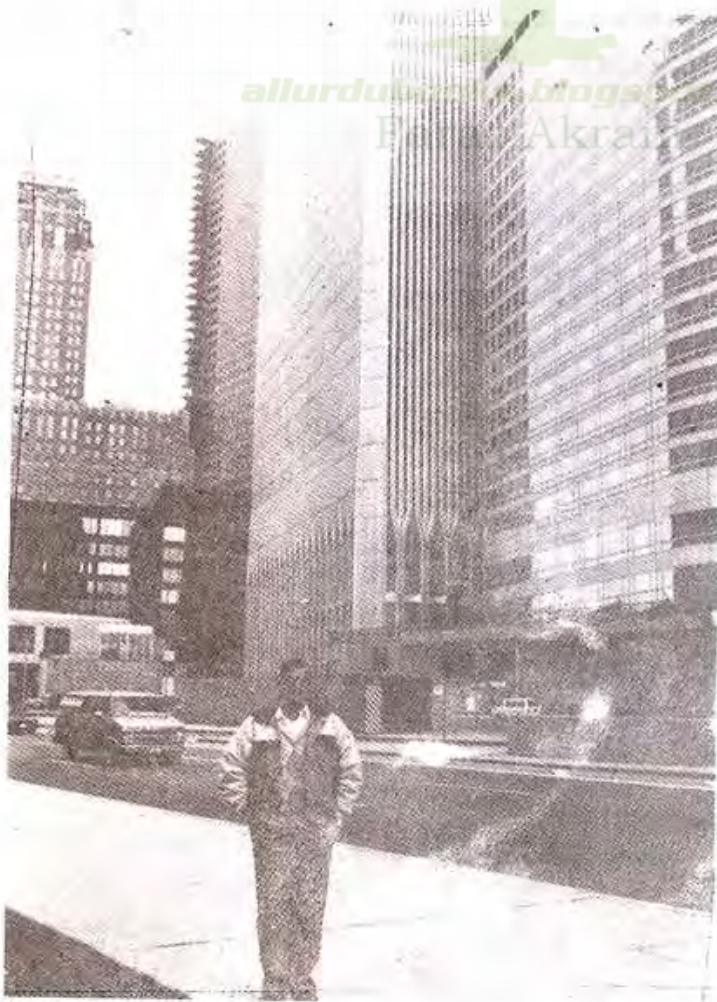
ورلڈ ٹریڈ سنٹر نیویارک