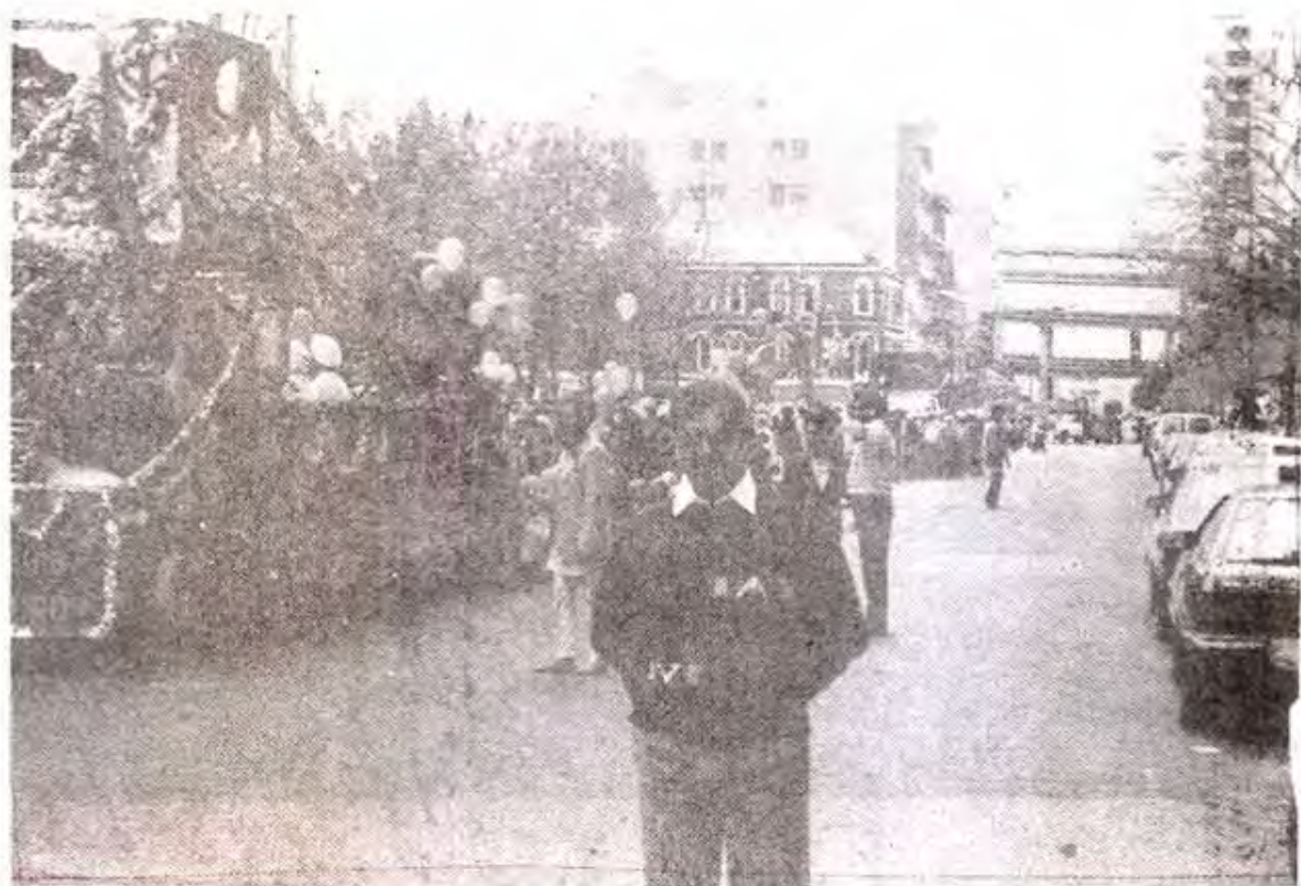
سان فرانسسکو کی مشہور سکھ پریڈ کے ساتھ