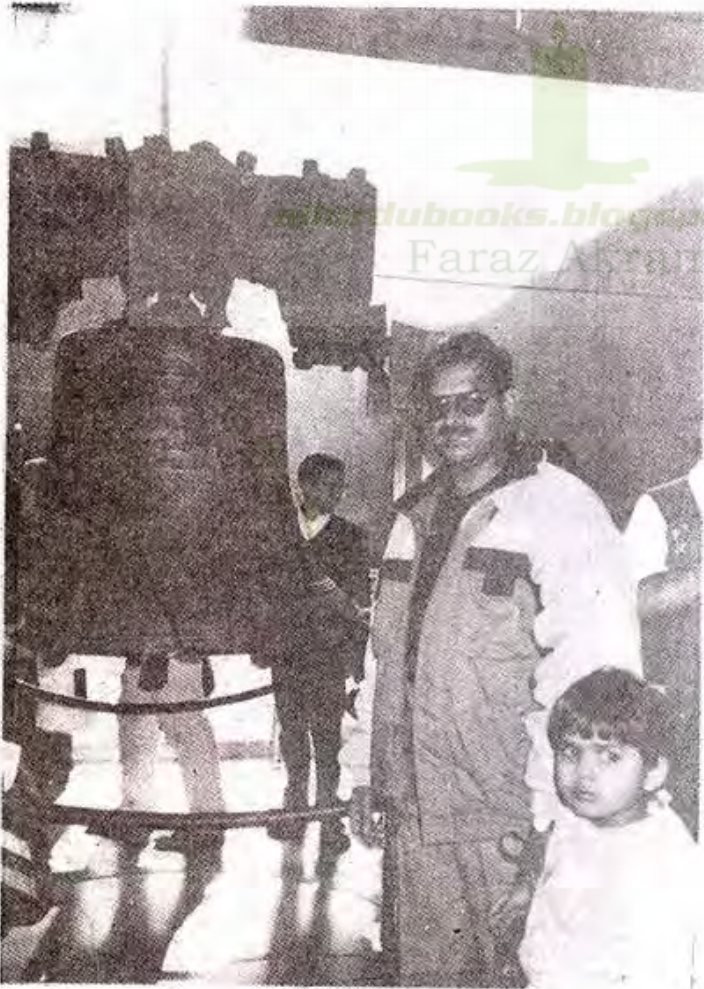
بیل آف لبرٹی فلاڈلفیا میں