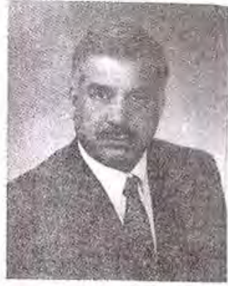
پروفیسر قاسم حسین سید