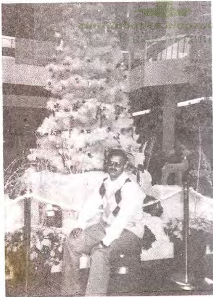
فلڈ ڈلفیا کے مشہور تجارتی مرکز "گیلری" میں گرمس ٹری کے ساتھ